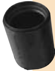
プラスチック 2次加工部品