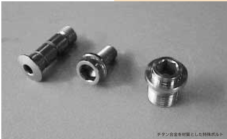
チタン合金を材質とした特殊ボルト

その結果、今年2月に中国への歯根販売許可を取得されたこともあり、自社インプラント製品の販売拡大に対応するため、生産体制、生産技術の強化を図っておられます。また、さらに、歯根製品、整形外科手術関連製品の開発、それらの製品製造技術を活かした難切削材の複雑な形状の加工、例えば三次元形状の5軸制御加工や微細な加工についても積極的に取り組んでいく予定を持っておられます。