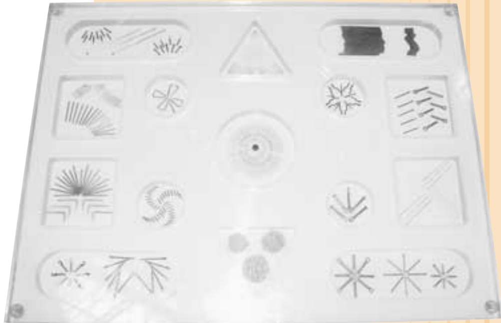
(株)電研端子製作所の製品