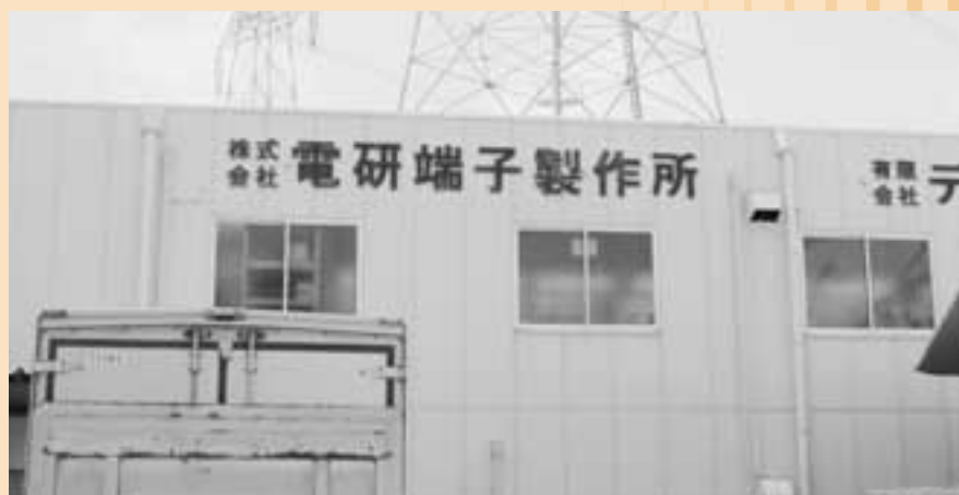
株式会社電研端子製作所

今日の生活は電子部品抜きでは語れません。例えば、パソコン、携帯電話、時計、車、さらにはエアコンなどの電化製品全般から産業用ロボット、宇宙ロケットまで実に多種多様な製品に電子部品は欠かせません。