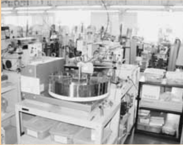
高い品質マネジメントを誇る会社