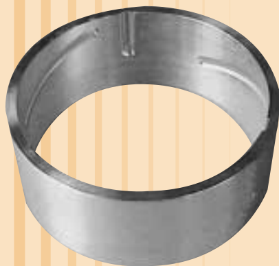
インナーカム部品