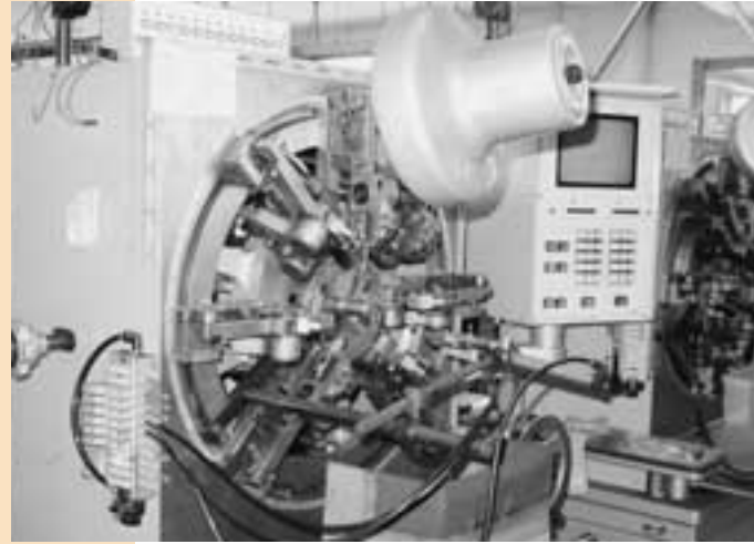
会社で作っている製品は、数センチか数ミリまでの小さな部品

自動車、医療では薄板材のプレスフォーミング加工や切削加工を得意としており、電子部品においては、ストリートリード又は、超微細プレス加工、ファインフラット加工等、用途に対応した加工法にて、低コスト商品を市場へ提供しているのです。