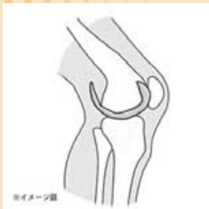
チタン合金による人工関節用インプラント