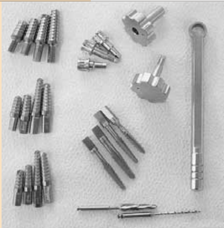
自社設計歯科用インプラント