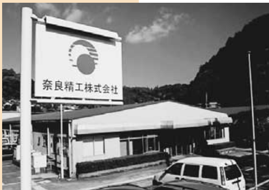
奈良精工株式会社：外観

桜井市にある奈良精工株式会社は今年、(財)奈良県中小企業支援センターを通じて、自社の経営革新計画を提出し、奈良県から中小企業経営革新支援法に基づく承認を受けられました。同社の経営革新計画について紹介させていただきます。