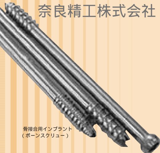
骨接合用インプラント (ボンスクリュー)

特に同社の難切削加工技術については、超硬部品（鏡面仕上げ、斜め穴加工）の加工、チタン合金・コバルトクロムモリブデン合金の人工関節部品などの高いレベルでの実績が既にあります。このような分野の生産、営業強化を図ることにより、今後ますます同社は高付加価値を備えた企業となるでしょう。