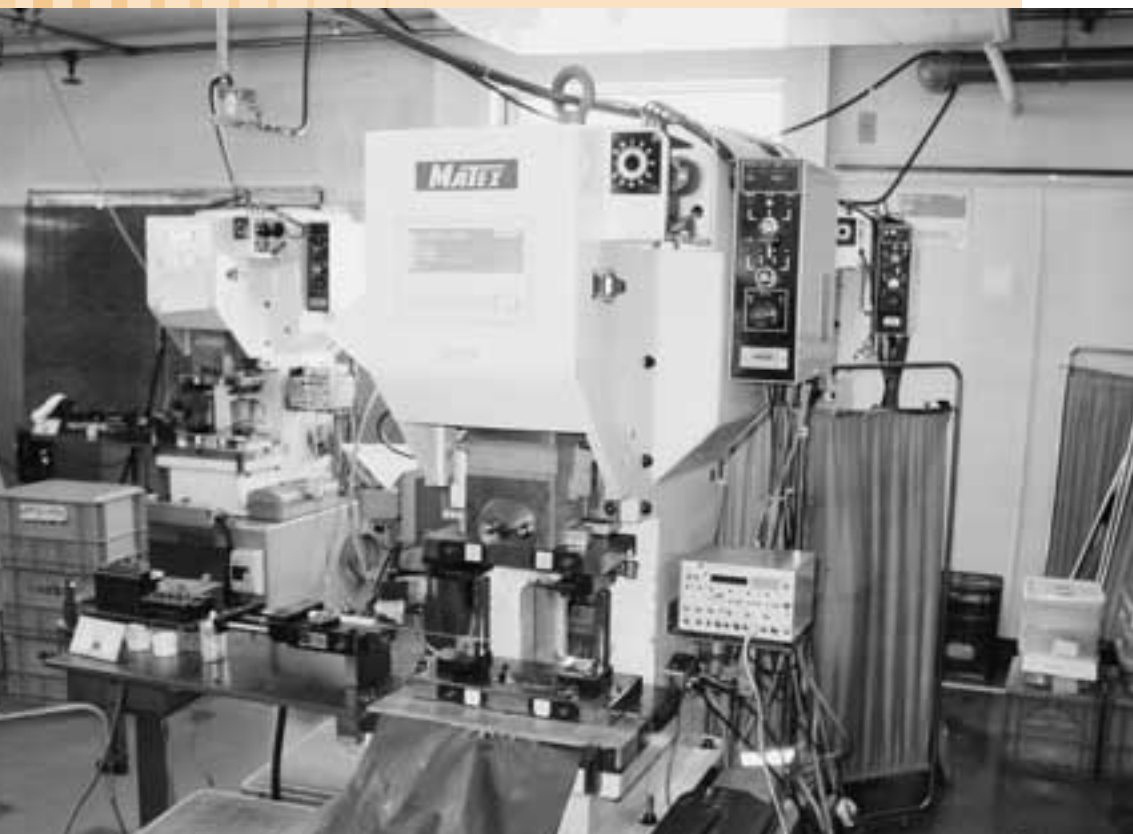
会社は、ISO9002を認証取得している

現在、同社の製造設備の多くは自社製であり、独自の生産技術によって、高速化、24時間無人化を推進していますが、その発展の一端に当支援センターの制度も寄与することができました。今後も同社は「ムダ」「ロス」を排した、「一貫生産システム」をベースに設備の機能性を充実させることで、強い市場競争力を保っていくことを考えているのです。